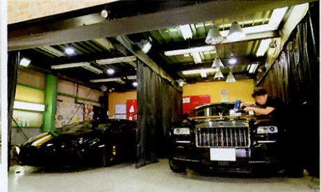
←きれいに磨き上げた後はファイナライズ処理設備内でコーティング施工。その後はクルマを移動することなくファイナライズ処理を施すのでホコリの心配もない。 ↑濃色車では見えにくいキズも見つけて磨き上げられるようブラックブースを設置。また光源も多彩なので完璧な磨きが可能だ。