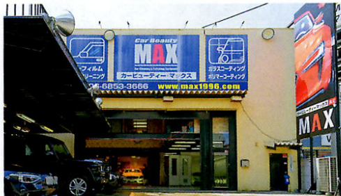
店舗は防塵ガラスに冷暖房完備。そして宝石店クラスのセキュリティを導入。万が一の時の保険も加入し高級車も安心して預けられる環境が揃っている。

世 界に冠たるプレミアムカーにはカーコーティングを施すならば、やはり良いものを選びたいと思うのは当然。だから、施工技術や素材に注目して施工店を選んでいる人が多いと思う。 だが、プレミアムカーを預ける時には、施工技術や素材に加えてセキュリティや保険といったリスクマネジメントもまた重要なポイント。カービューティーマックスにプレミアムカーが集まる理由のひとつは、技術や設備だけでなく、安心して預けられる体制が万全だから。セキュリティシステムは、宝石店などにも導入されている堅牢なものを採用。車両移動時のリスクのために、万が一のトラブルに備えた保険にも加入する。だから、どんなプレミアムカーでも受け入れることができ、かつ