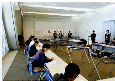
社団法人日本コーティング協会・3級試験はコーティングに対する基礎知識をテスト。業界の礎となる共通認識を作るテストにカービューティーマックスは協力している。