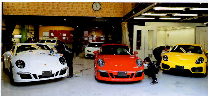
技術はもとより対応・説明に至るまできめ細かなサービスを提供。明確な基準が見えにくい業界だけにお客さんに理解していただくためには当然という。