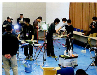
2級検定の様子。黒いボンネットのキズを消す作業による試験において、そのノウハウを研磨塾などで披露している。