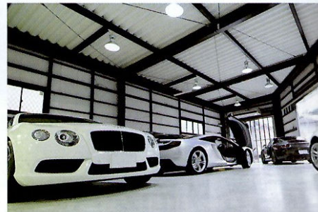
施工後は防塵の第2店舗で保管。宝石店レベルのセキュリティを導入し保険も加入しているの、高級車でも安心して預けることができる。