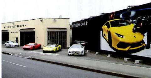
日本コーティング協会を通して業界の発展を願うカービューティーマックスは、一般ユーザーはもちろん、同業者にとっても心強い存在。

臨 機応変。コーティングの作業では常に求められることだが、そのような行動ができるようになるためには、日々の切磋琢磨が重要だ。カービューティーマックスが支持される理由は、成果が結果として現れているからだ。 その一例が、ポリッシング。世界のモーターショーで活動し、その場の状況や条件、そして塗装の特徴などに対して柔軟に対応しながら最高の輝きを引き出すことは、技術・知識ともに高いレベルでの物差しがなければ不可能。つまり、これがあるからこそ、ユーザーの要望に対して柔軟に対応できるのだ。 さらに特筆すべきは、ポリッシング後に施工するコーティングを完璧に仕上げるための設備をきっちりと取り揃えていること。 施工・ファイナライズ処理設備の開発も、全ては究極の輝きのためである。これはコーティングを知り尽くしているからこそその設備だ。 社団法人・日本コーティング協会の基準作りや、東京モーターショーでBMWプールの車両の磨きを担当したカービューティーマックス。その理由は、やはり確たる「物差し」があるからといえよう。