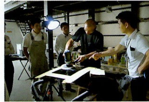
コーティング業界の基準を作るだけでなく、経験から得た技を伝えることによりコーティング業界の底上げを行っている。