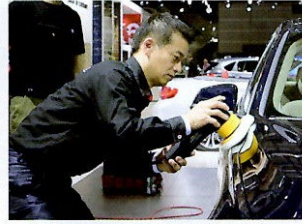
パリ・サロンでの友成氏。ショーの作業は、ゴルフ同様「グリーンの芝の目を読みながら最善策を探る思考」が必須。経験がモノをいう。