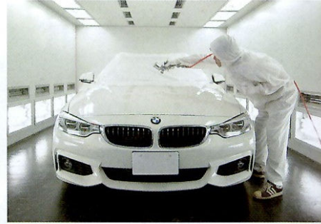
コーティングはホコリをシャットアウトするファイナライズ処理設備内で施工。衣服に付いたホコリも考慮して作業着も専用用品を使う。