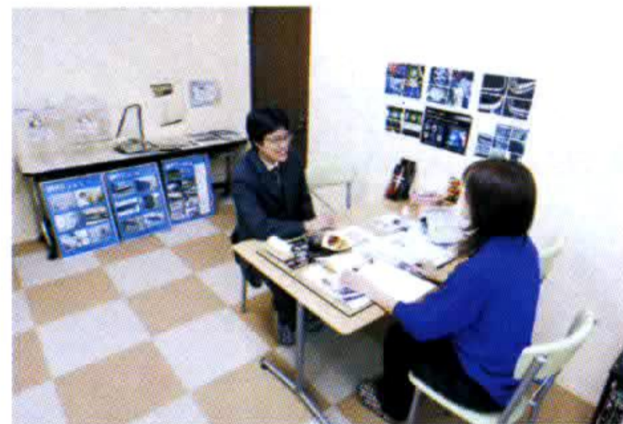
アルティメイトプロの施工は、直接来店して頂いたオーナーのみを対象とした限定サービス。親切丁寧にスタッフが説明してくれる。