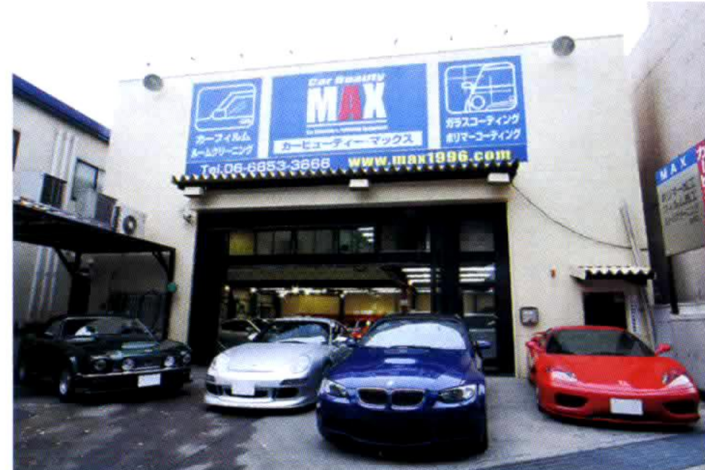
あらゆる車両が集う同店は阪神高速池田線の北行き側高架下に位置しており、アクセスも抜群。一般ユーザーの多くがリピーターとなっているとか。