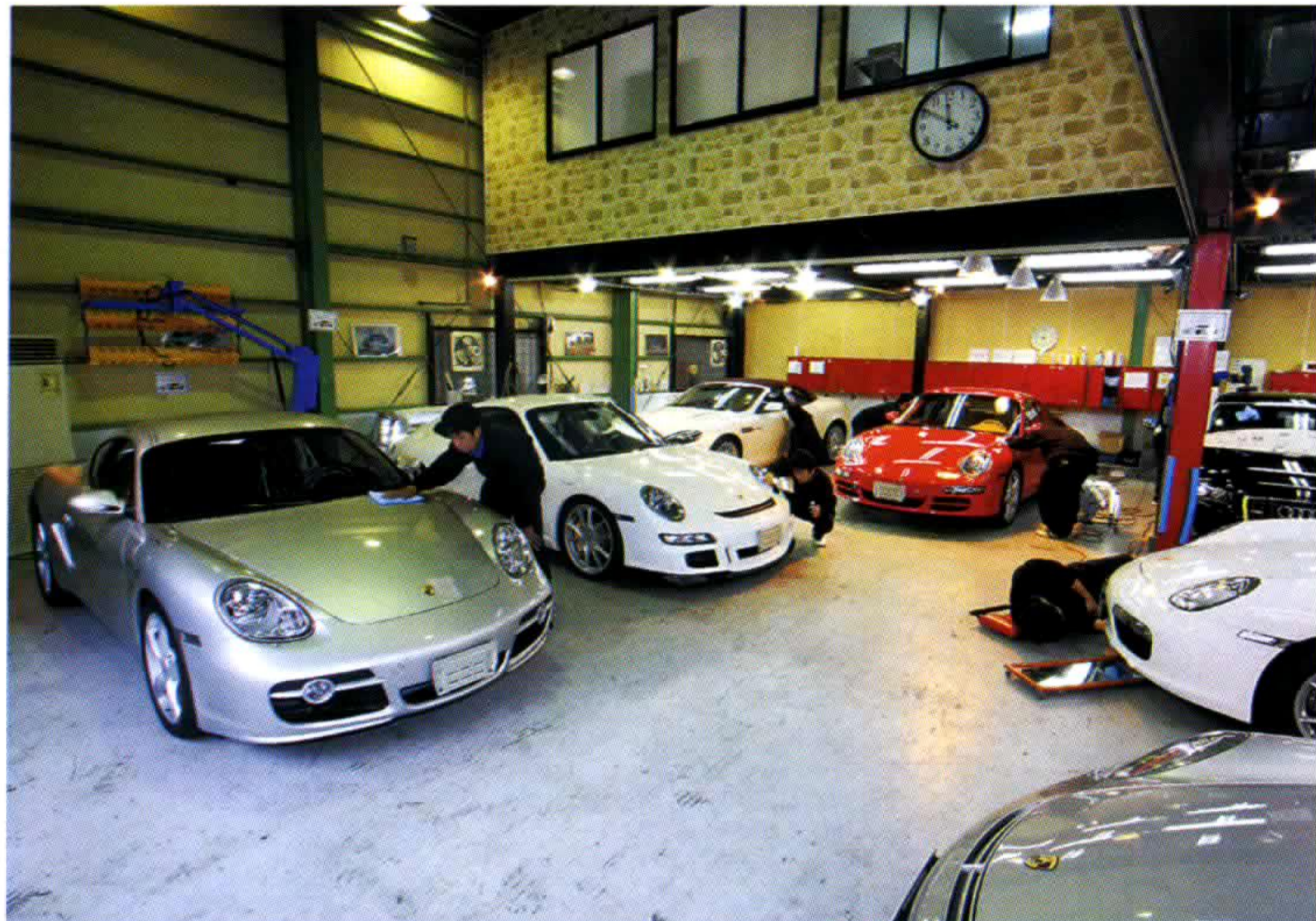
ディテイルショップではめずらしく広いスペースを誇るマックス。ポルシェはもちろんフェラーリやランボルギーニ、メルセデス、BMWなど輸入車全般を扱う。もちろん技術もアフターフォローも申し分ナシの体制だ。