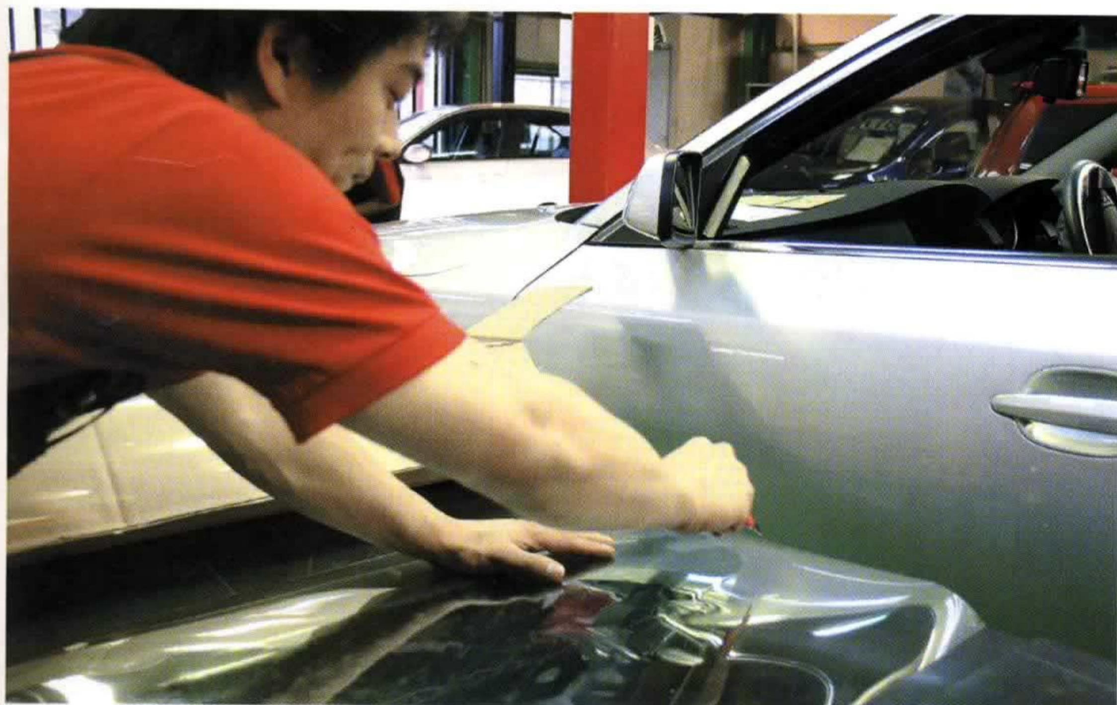
防犯フィルム“ルミバリア”の作業は、通常のフィルム・メイクと異なり工程数が多い。納期・料金等は問い合わせを。