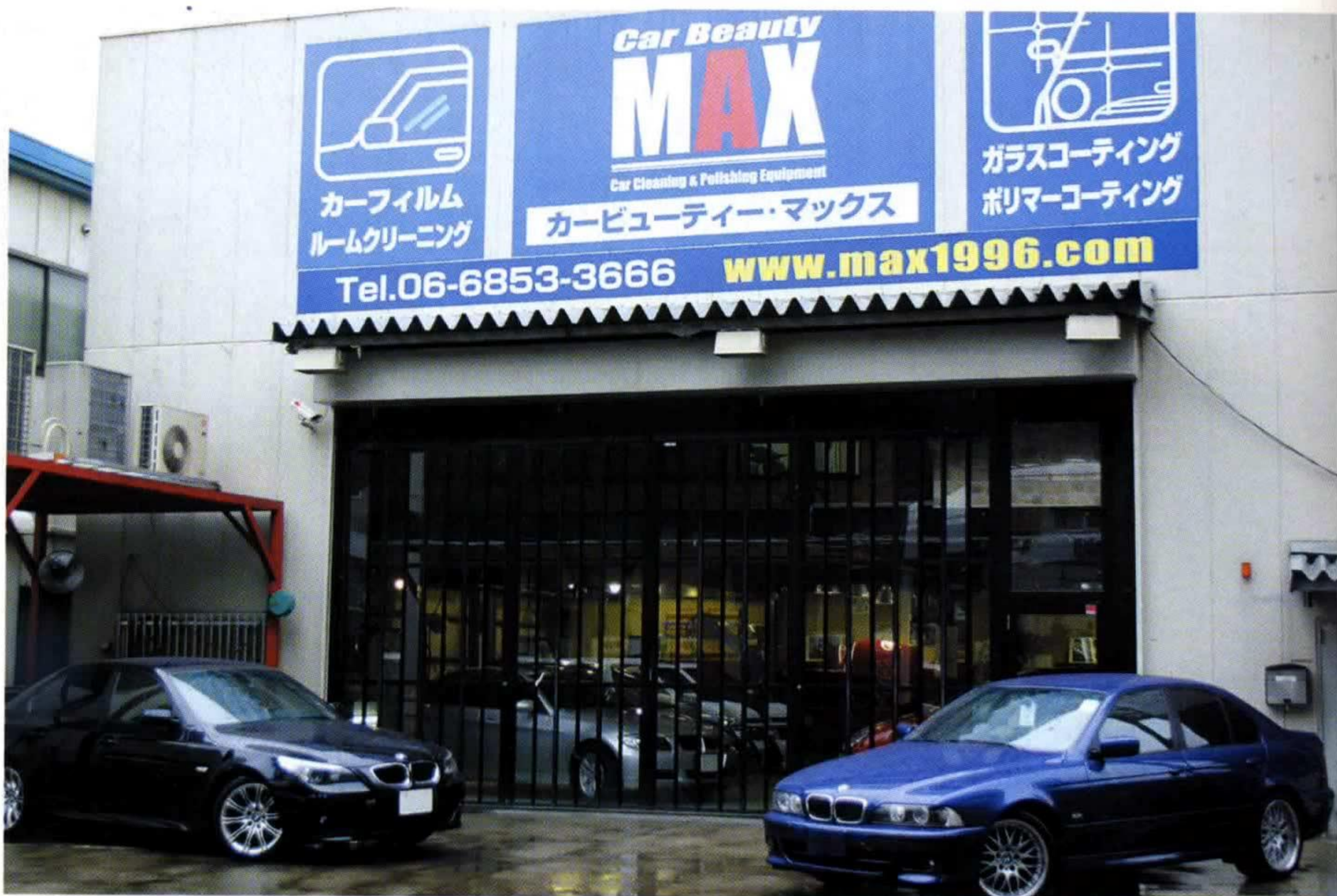
名神・豊中ICを降りて、阪神高速池田線の高架沿いに北上。約5分強も走れば、左手にカービューティー・マックスのファクトリーが見えてくる。

意外とゴミや汚れが溜まるモール内。取り外してディテールリング作業に入るのはココでは当然のこと。こういうキメ細かい配慮がウレシイ。