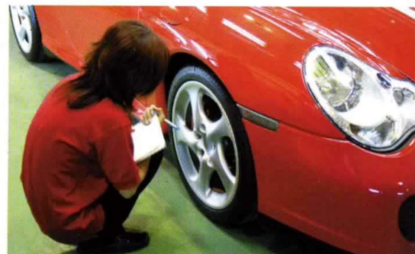
↑通りの作業を終えた車両は施工したスタッフとは異なるメンバーが独自の項目に基づいて厳しくチェック。品質管理体制も万全といえる。